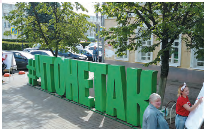
уличный опрос жителей г. Ярославль, ул. Кирова 05 / 07 / 2017