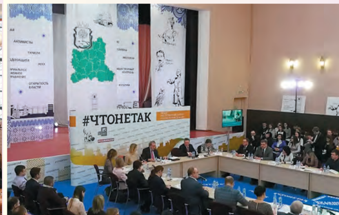
Круглый стол «#ЧТОНЕТАК» г. Липецк, 15 / 03 / 2018