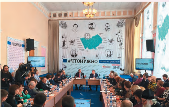
Круглый стол «#ЧТОНУЖНО» г. Барнаул, 02 / 03 / 2018

Ключевые участники: главы регионов, главы городов, руководители общественных организаций, представители региональной общественной палаты