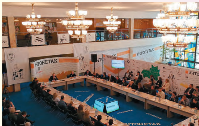
Круглый стол «#ЧТОНЕТАК» г. Иваново, 14 / 03 / 2018