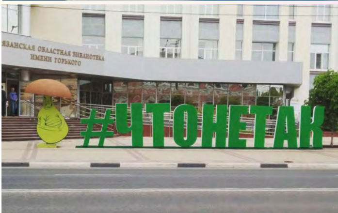
артобъекты в г. Рязань, библиотека им.Горького 25 / 05 / 2017

Артобъекты и уличные опросы служат дополнительным информационным поводом и инструментом получения обратной связи непосредственно от жителей городов