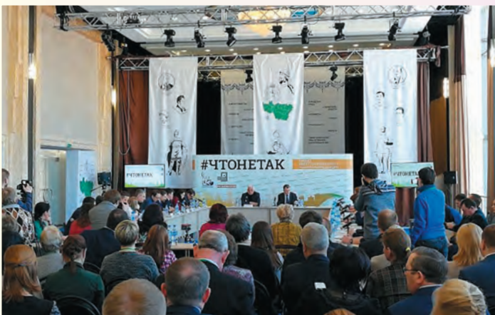
Круглый стол «#ЧТОНЕТАК» г. Владимир, 06 / 03 / 2018

Формирование списка спикеров: в ходе экспертного опроса, из разных направлений, с разным отношением к власти